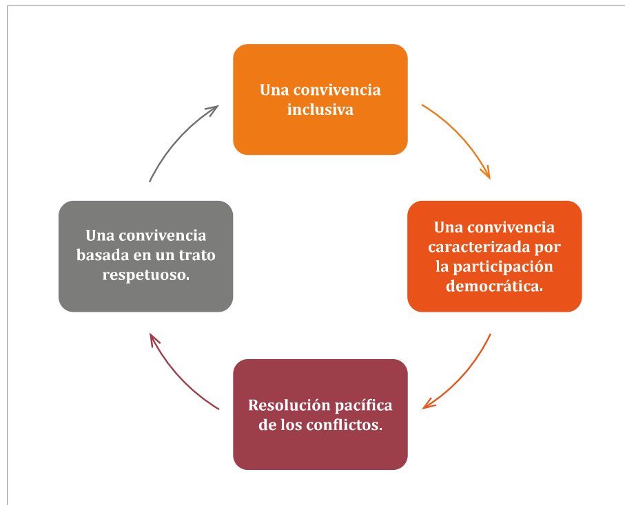
Figura 1. Ejes de la Política Nacional de Convivencia Escolar.

Es interesante recalcar que la PNCE tiene cuatro características que permiten la promoción de la convivencia escolar en los establecimientos educacionales.